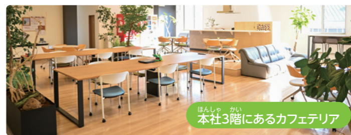
本社3階にあるカフェテリア

楽しく仕事をするには人と人とのコミュニケーションが大切と考える社長の提案でカフェテリアが作られました。